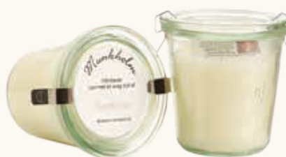
# 11129 Brændetid ca. 50 t. Gardenia