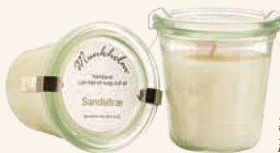
# 11110 Brændetid ca. 50 t. Sandeltræ