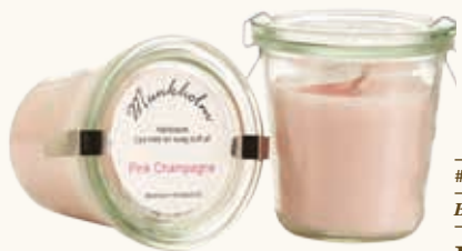
# 11151 Brændetid ca. 50 t. Pink Champagne