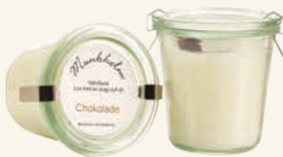
# 11104 Brændetid ca. 50 t. Chokolade