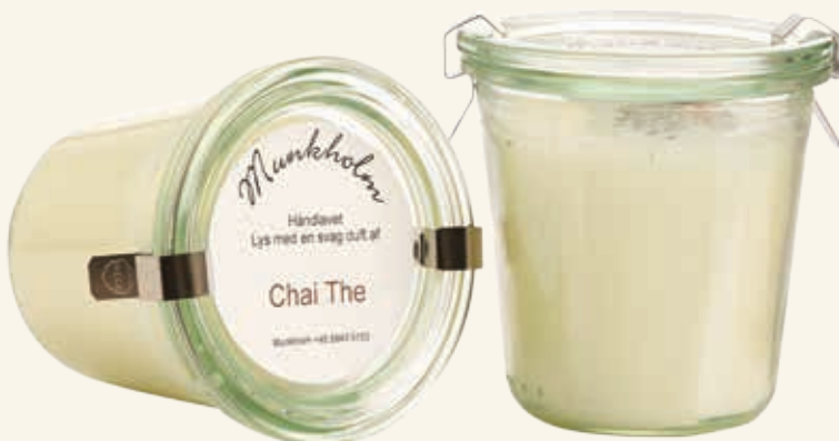
# 11137 Brændetid ca. 50 t.