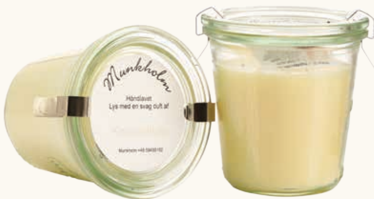
# 11139 Brændetid ca. 50 t.