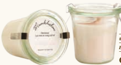
# 11153 Brændetid ca. 50 t. Candy Cane