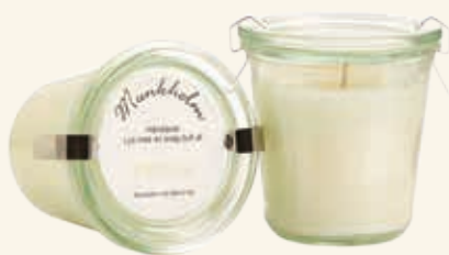
# 11148 Brændetid ca. 50 t. Patchouli