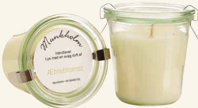
# 11103 Brændetid ca. 50 t.