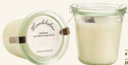
# 11109 Brændetid ca. 50 t. Jasmin