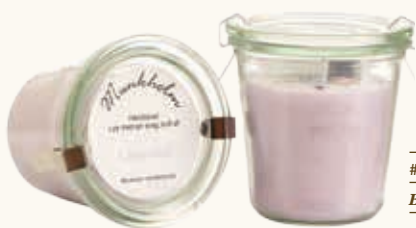
# 11101 Brændetid ca. 50 t. Lavendel