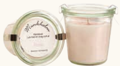
# 11102 Brændetid ca. 50 t. Rose