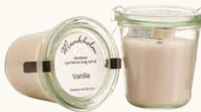
# 11145 Brændetid ca. 50 t. Vanille